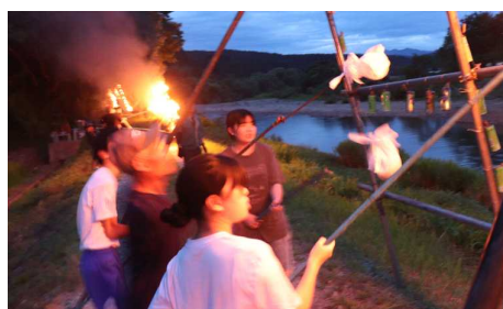
(「万灯火の作業工程」中学校3年生による活動の様子)